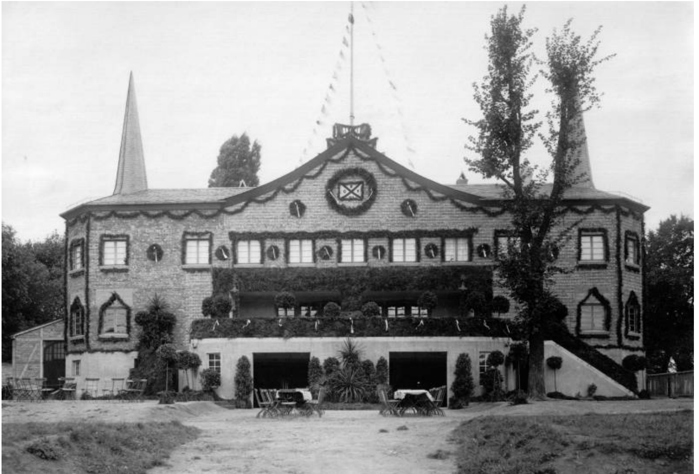
Das Neue Bootshaus am Tag der Einweihung