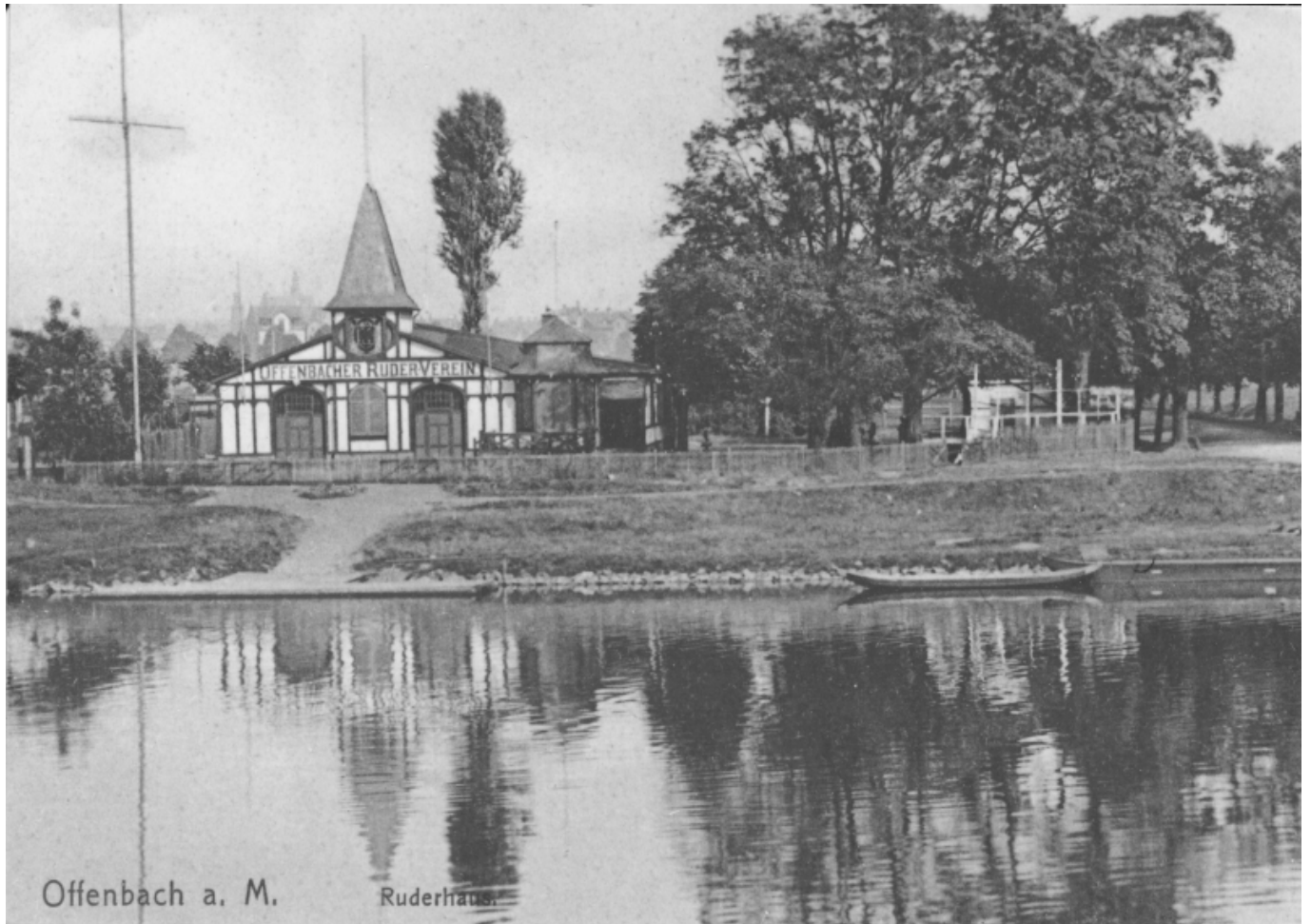
Offenbach a. M.